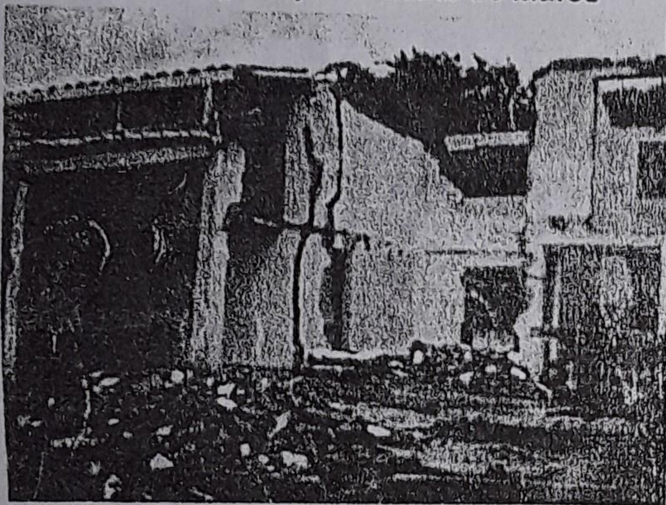
FOTO No. 1 Vivienda en proceso de demolición caída de techo y desplazamiento de muros

En la visita realizada el pasado 17 de octubre de 2007 al sector de la Esperanza, en la vereda La Holanda parte alta se encontró inicialmente como en la vía de acceso al sector Piedras Negras se presentan una serie de hundimientos en la carretera, algunos de los cuales vienen acompañados de grietas y desniveles de hasta 40 centímetros de altura, con agrietamiento de una vivienda ubicada a un costado de la vía por desplazamiento entre las columnas y los muros; al retirarse de la carretera hacia los lotes inferiores fueron observadas dos casas con destrucción total de techos y muros debido a los desplazamientos de hasta 80 centímetros de un bloque del terreno limitado por plano de falla perfectamente demarcado.