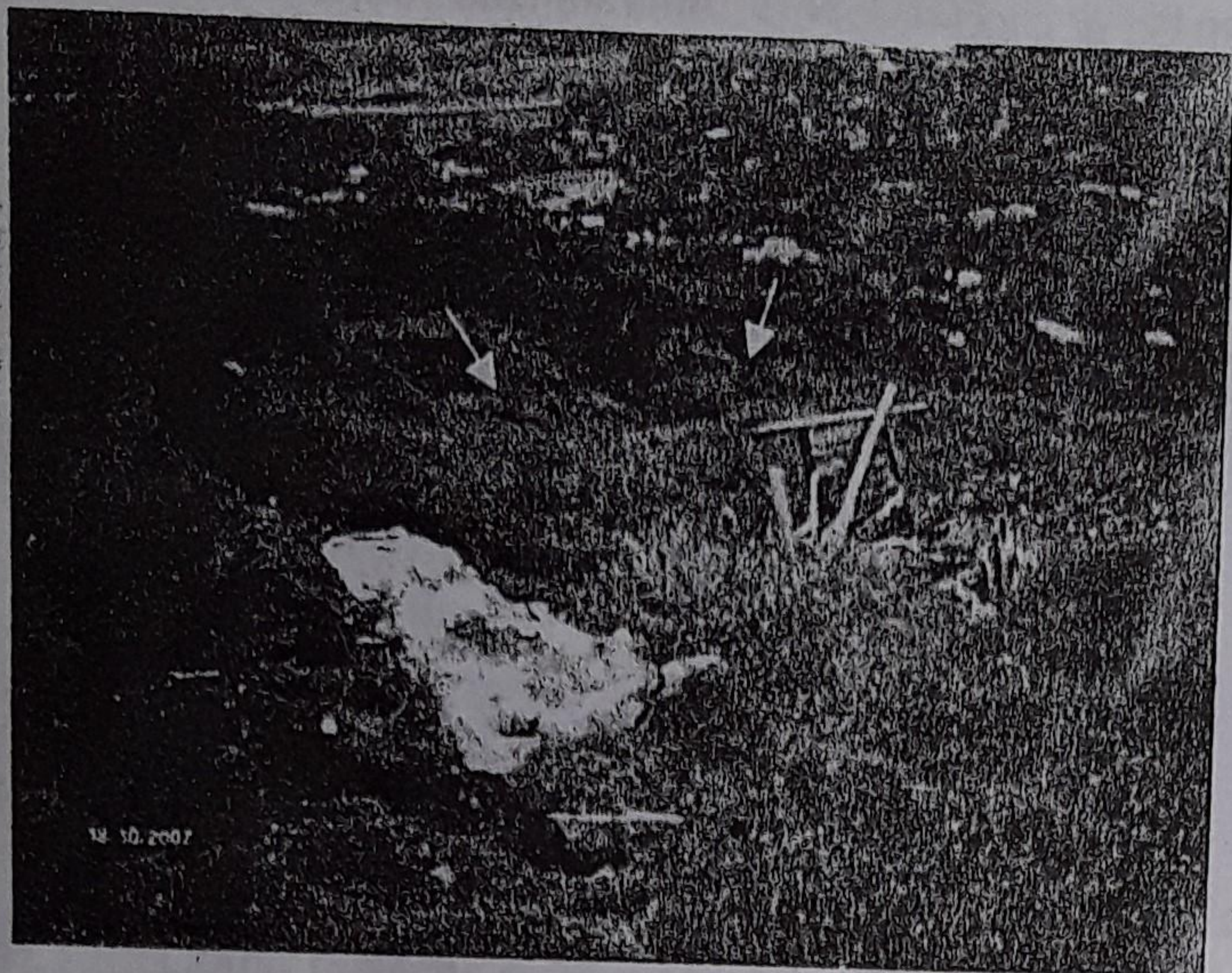
FOTO No. 3 Grietas en la corona del deslizamiento y parte del bloque desprendido

Es de anotar como en la corona del deslizamiento se evidencia que fueron realizados movimientos de tierra con maquinaria, cortes en el talud para adecuación de una carretera y movimiento de grandes bloques de roca cuarzodiorítica, algunas de ellas fracturadas al parecer mediante explosivos. Las huellas indican que hubo una remoción reciente de suelo en la corona del deslizamiento, aunque se nota que la carretera acondicionada no ha sido utilizada muy frecuentemente.